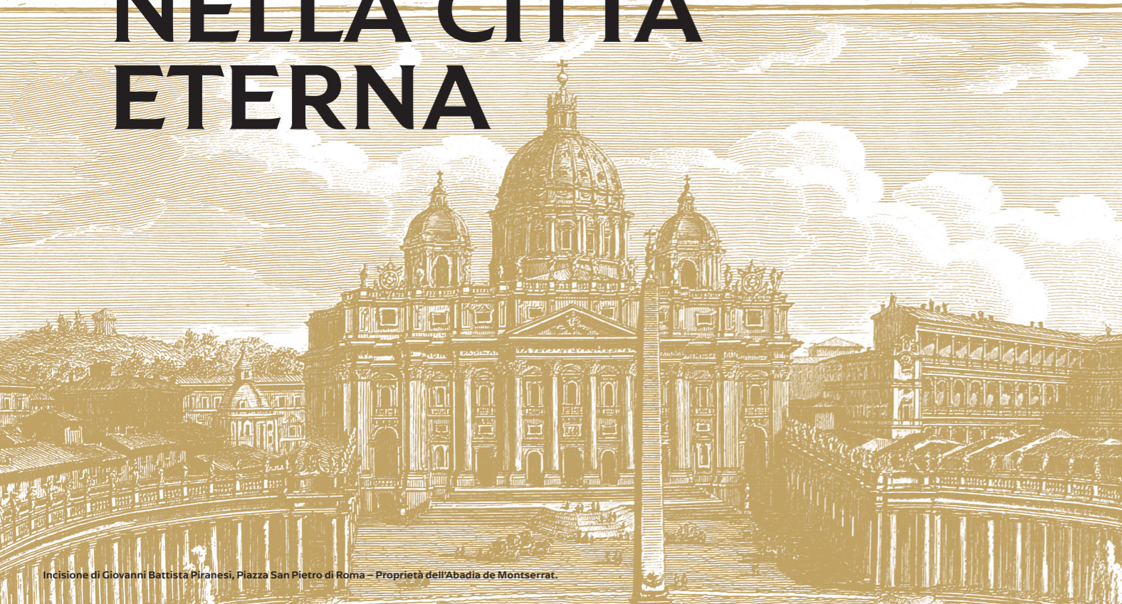
Incisione di Giovanni Battista Piranesi, Piazza San Pietro di Roma - Proprietà dell'Abadia de Montserrat.